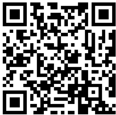
(a)大赛官方网站二维码