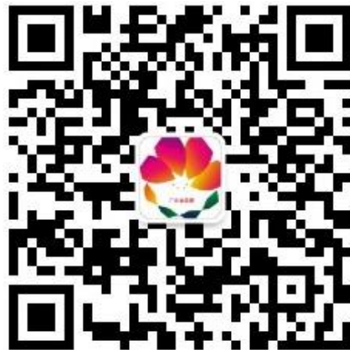
(b)大赛公众号“粤省赛”